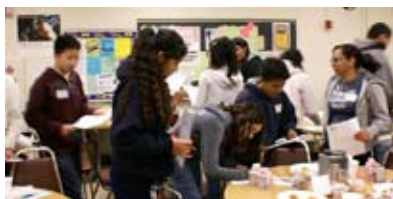
Platicando entre estudiantes acerca de sus experiencias en las cafeterías de sus escuelas durante la actividad de Bingo Humano